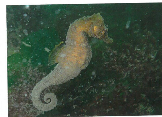
mijn huid tintelt er van!

Ik weet dan nog niet dat de maand erna op andere locaties ook zeepaardjes zullen worden gespot. En laat nu heel toevallig onze duik van de Duik Buddy's Dordrecht gepland staan naar een van die locaties. En zo gebeurt het dat ik voor de tweede keer de zeepaardjesbeleving mag meemaken. Mijn buddy's zien ze voor het eerst. Inmiddels gaan we richting het najaar. Het mooie aan onze hobby is dat er het hele jaar door gedoken kan worden. Ieder seizoen zien we zo het onderwaterleven veranderen. Rond