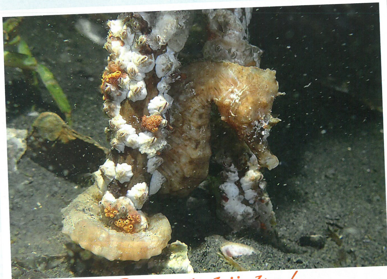
Daar zit hij dan!