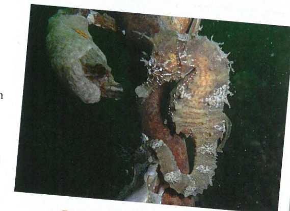
op een sepiastok

mei/juni vraag je je, als je langs de sepiastokken komt, af of er al eitjes zijn afgezet. Komen we misschien zelfs volwassen sepia's tegen? Daarna zie je de schattige babysepia's, nog niet eens zo groot als je vingertop. En als je wekelijks meer dan één duik maakt, zie je ze steeds vaker langskomen en opgroeien tot volwassen sepia's. Leuk om al die fases te kunnen waarnemen. Zo komen ook de kreeften en krabben voorbij, zoveel soorten dat ik de meeste niet eens ken. Fijn dat we tegenwoordig zoveel informatie tot onze beschikking hebben. Voor de wekelijkse buddyduiken bekijk ik even de app van de Duikersgids. Dan lees ik bijvoorbeeld dat op de te beduiken stek in die periode galatheakreeften zitten. Moet ik toch wel even googelen om te kijken hoe zo'n kreeft er uitziet. Dan is de missie tijdens die duik natuurlijk om er eentje te vinden! En hoe leuk